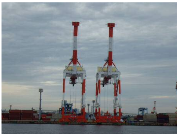
C9岸壁に搬入されたガントリークレーン